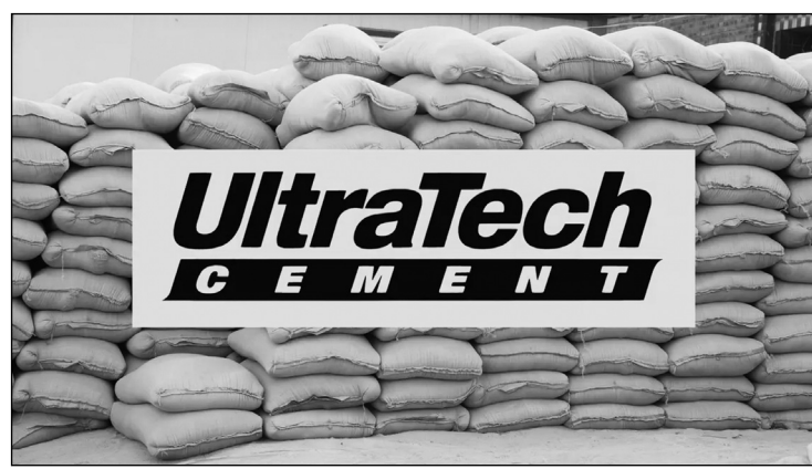
कंपनी ने एक बयान में कहा कि इस विस्तार के बाद उसकी कुल उत्पादन क्षमता बढ़कर 18.2 करोड़ टन प्रति वर्ष हो जाएगी। इसकी मौजूदा क्षमता 13.24

बिजनेस रेमेडीज/नई दिल्ली। सीमेंट उत्पादक अल्ट्राटेक ने अपनी वृद्धि के तीसरे चरण में अपनी क्षमता में 2.19 करोड़ टन प्रति वर्ष की बढ़ोतरी करने के लिए 13,000 करोड़ रुपये का निवेश करने की घोषणा की।